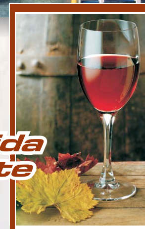
Salida a Cliente