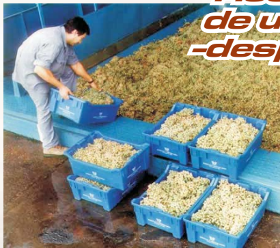
Recepción de uva -despalillado-

Previamente a la instalación del sistema de trazabilidad realizamos un estudio de su bodega, obtendremos los diferentes estados necesarios a registrar y gestionar en su bodega, por ejemplo: